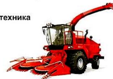
комбайн для уборки зерна

2. Игра «Сложные слова» (образование односложных слов – название специального транспорта).